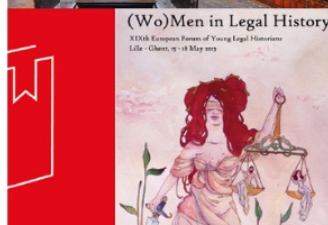
(Wo)Men in Legal History XXXIX European Forum of Young Legal Historians Lille - Ghent, 17-18 May 2013